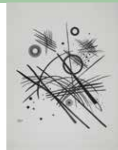
Wassily Kandinsky, o.T., 1924