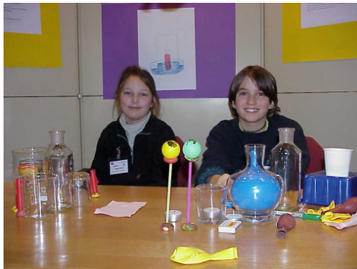
Teilnehmerinnen Jugend forscht/ Schüler experimentieren 2006

Mit der Ausrichtung des Regionalwettbewerbs von Jugend forscht, wird ein weiterer Meilenstein in Richtung Kinder- und Jugendstadt gelegt. Gerade in Zeiten, in denen das deutsche Bildungssystem in der Kritik steht, möchte die Stadt Sindelfingen einen Beitrag zur Nachwuchsförderung leisten und den Jugendlichen eine Orientierungshilfe für die spätere Berufswahl geben. Die Teilnehmer/innen von Jugend forscht sind die „Forscher von morgen“ und genau dieses Potenzial braucht ein Standort wie Sindelfingen. Nachwuchskräfte sollen von Anfang an unterstützt und gefördert werden.