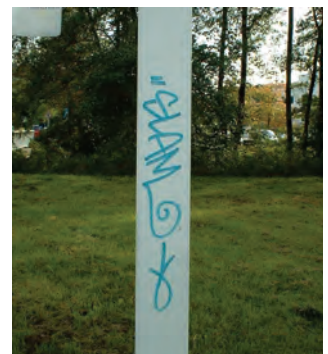
Abb. 88: Schriftzug, „tag“, auf einem Beleuchtungsmasten