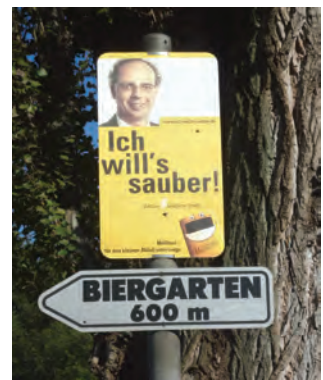
Abb. 79, 80, 81: Sindelfinger Bürgerinnen und Bürger auf Einzelplakaten mit dem Leitmotiv „Ich will's sauber“ an exponierten Stellen an Straßen- und Wegekreuzungen