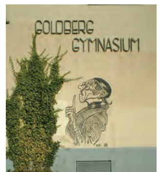
Abb. 89: „Lehrer Lämpel“ an der Außenwand des Goldberggymnasiums