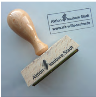
Abb. 83: Stempel mit Motiv „Aktion saubere Stadt“