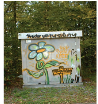
Abb. 86: Graffiti-Bild auf der Wand einer Umspannstation beim Badezentrum

Aus diesem Grund wurde in einer verwaltungsinternen Arbeitsgruppe nach ausführlicher Diskussion beschlossen, offensive Maßnahmen gegen Graffiti zu vermeiden. Sollte sich die Graffiti-Szene in Sindelfingen merklich verändern, ist diese Vorgehensweise zu überdenken und ggf. zu modifizieren. Ein Meilenstein, der zur Bewe-