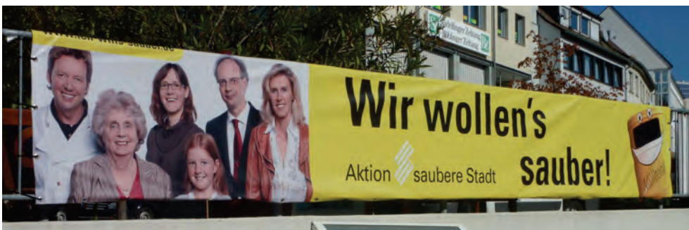
Abb. 82: Banner mit dem abgeänderten Leitmotiv „Wir wollen's sauber“ an der Einfahrt zur Tiefgarage am Marktplatz