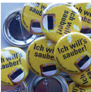
Abb. 84: Ansteckplakette mit Motiv „Ich will's sauber“

Folgende Maßnahmen wurden im Rahmen der Kampagne durchgeführt: