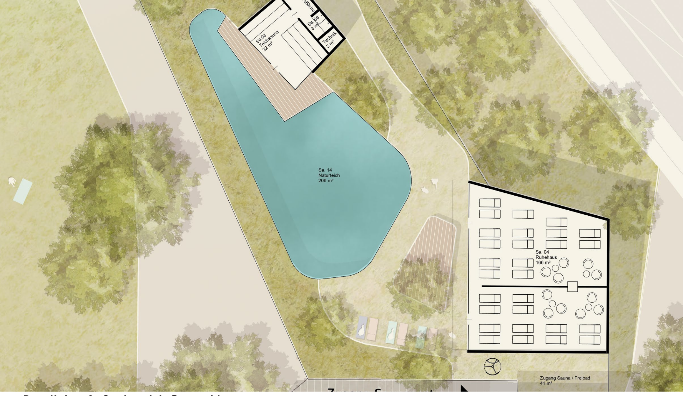
Detailplan Außenbereich Sauna M 1:200