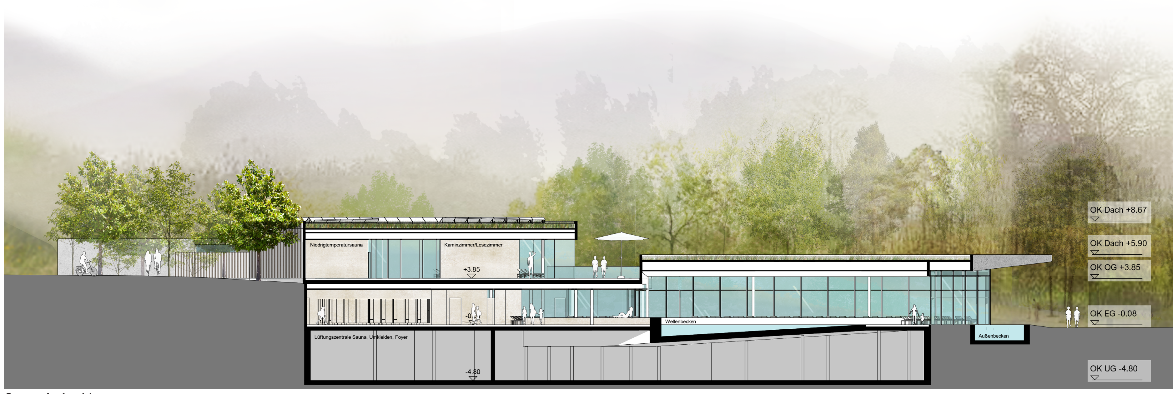
Querschnitt M 1:200